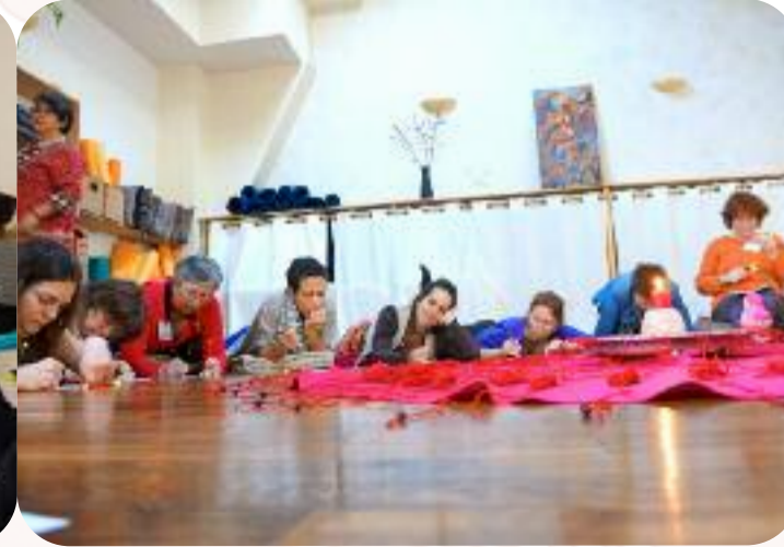
Une immersion dans l'expérience.