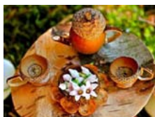
Thé avec les fées (blog twiqandtoadstool )