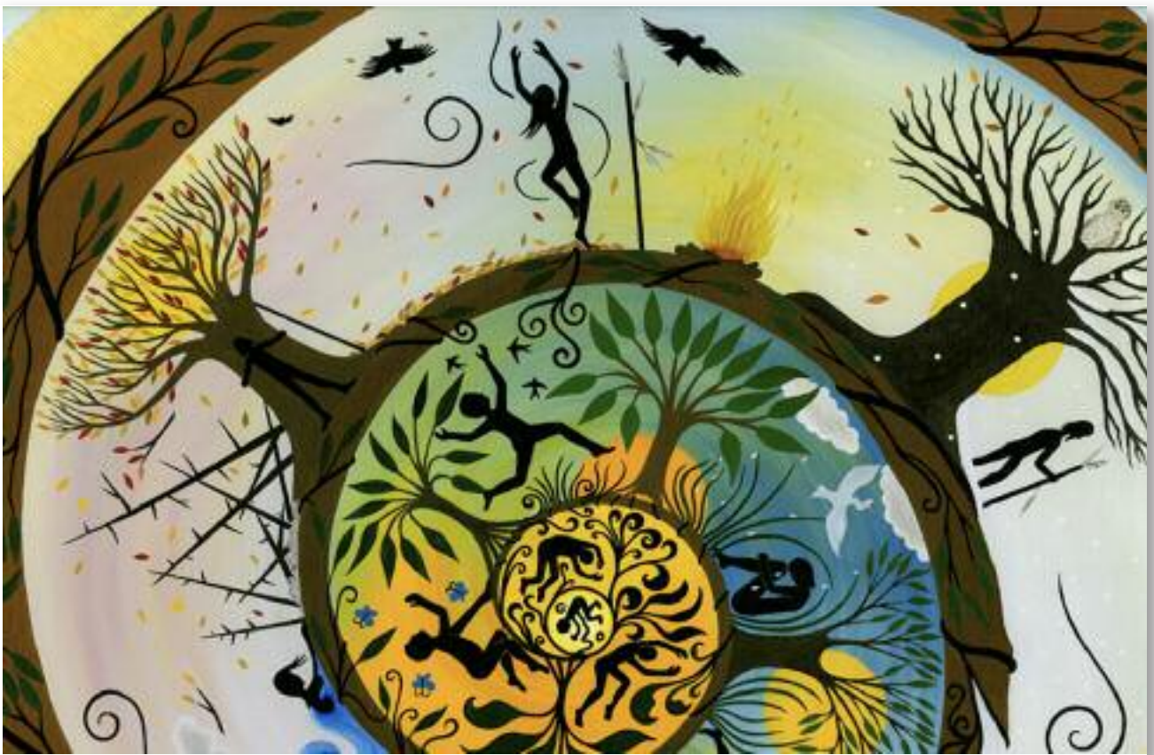
© Gaïa Orion - www.artbygaia.com - « Wholeness »