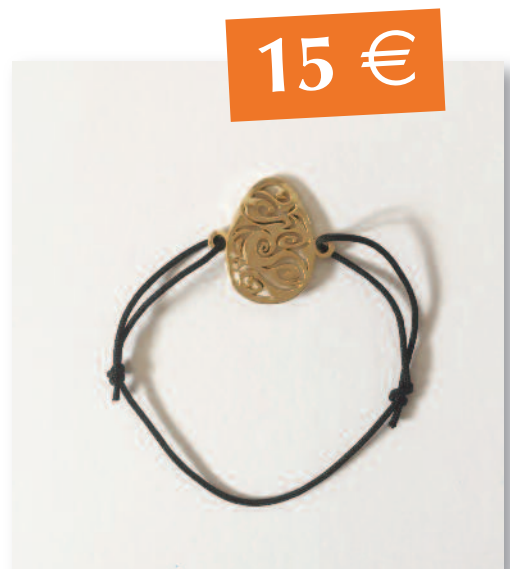
BRACELET « XX » métal + lamination or 24K (flash)

Créés par Imanou, egg designer du Festival du Féminin et Fabrika