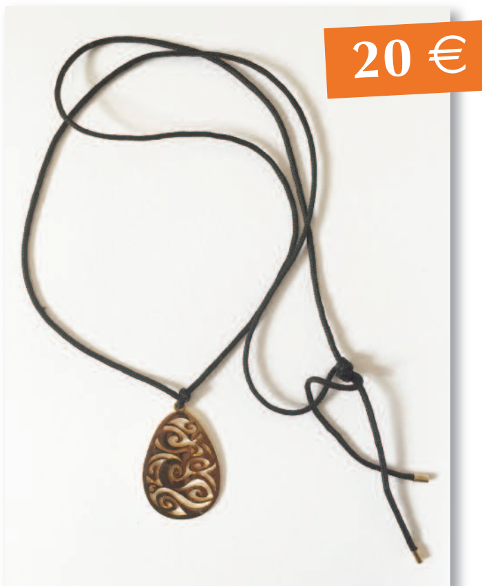
PENDENTIF « XX » métal + lamination or 24K (flash)