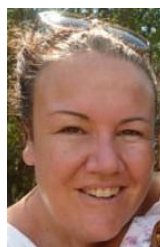
Création du logo du Festival : Imanou Risselard