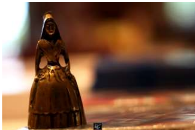
La gardienne du temps