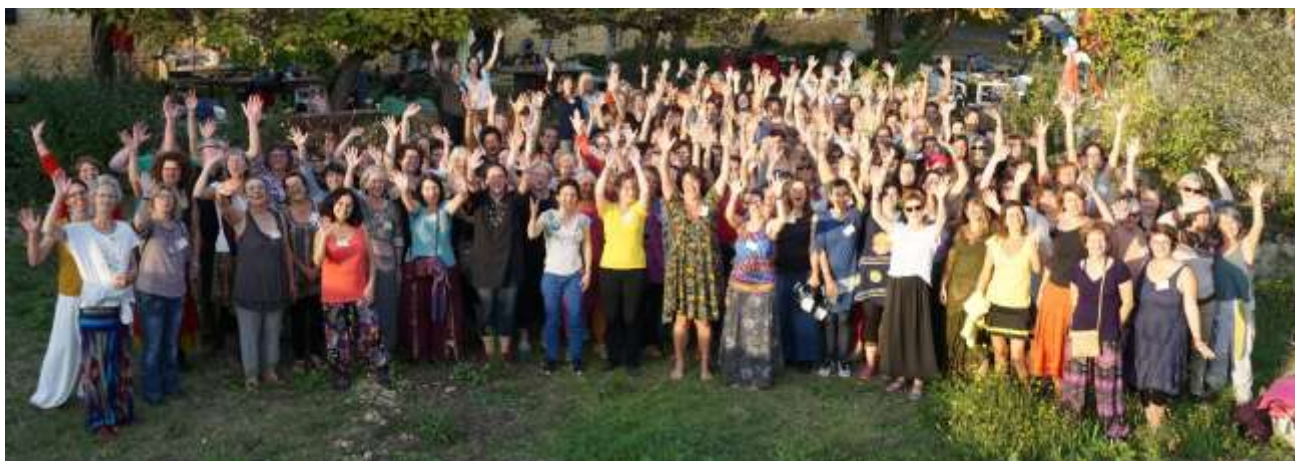
Festival du Féminin 2018

Nous sommes en lien avec des femmes et des hommes du Québec, Tours, Bruxelles, Guadeloupe, Rennes, Bangkok, Toulon, Martinique, Auroville, Singapour, Casablanca, Colombie, Houston, Montpellier, Mexique, Vosges, Aix-Les-Bains, Saint-Vallier-de-Thiers, Guadeloupe, Nouvelle Calédonie, Hong-Kong, Kuala Lumpur, Lyon , Grenoble.